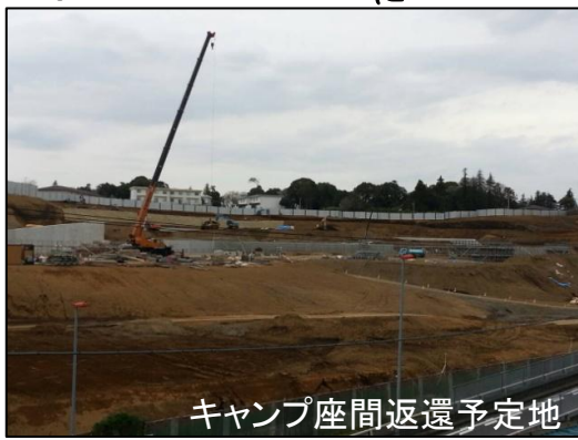
キャンプ座間返還予定地

この陸上総隊の創設につきましては、現状の我が国を取り巻く安全保障の状況、国際情勢からすれば、私は必要なものと冷静に受け止めております。昨年3月26日より移駐をしております中央即応集団につきましては日米同盟を基軸とした我が国の平和と安全の維持、そして多岐にわたる国際貢献活動など、昼夜を分かたず崇高な使命感を持って任務に当たって頂いており私としても大変誇らしく思っております。